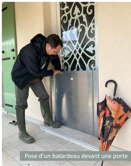
Pose d'un atardeau devant une porte

Le risque inondation concerne plus de 50 000 habitants sur le bassin versant des Gardons. L'EPTB Gardons est en charge de la prévention de ce risque sur ce territoire pour le compte des communautés de communes et d'agglomération.