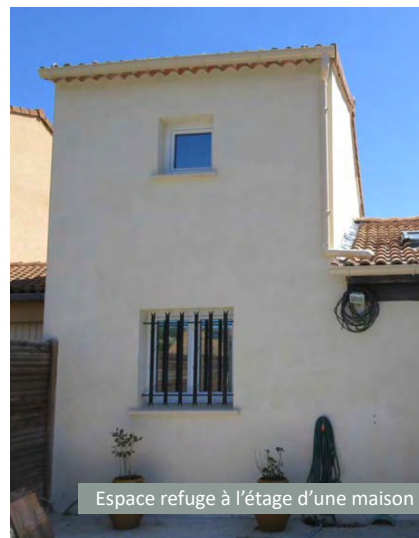
Espace refuge à l'étage d'une maison